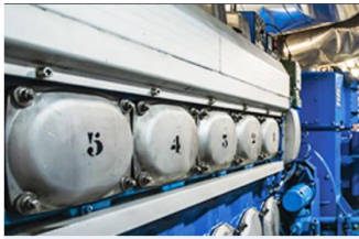
発電機の振動監視

初期段階でモーターの問題を特定し、メンテナンス効率と稼働時間を向上させることができます