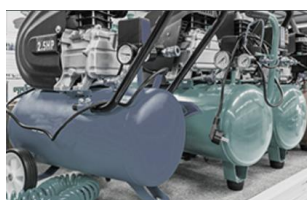
エアコンプレッサアセット管理

機器ステータス管理ダッシュボードによる作業モード、排出温度/圧力、ロード/アンロード圧力のリアルタイム状態監視が可能なエアコンプレッサアセット管理を実現します