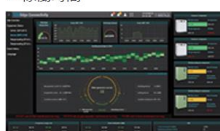
スクリーコンプレッサ