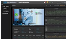
フィールドサイド監視