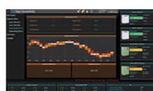
レシプロコンプレッサ

機器ステータス管理ダッシュボードによる作業モード、排出温度/圧力、ロード/アンロード圧力のリアルタイム状態監視が可能なエアコンプレッサアセット管理を実現します