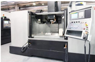
より高いコンピューター性能と2D/3Dディスプレイ容量を提供

SRP-E2i120 は施設の実タイムの振動監視、時間周波数振動データ解析、アラーム管理/保守を容易にします。アプリケーションダッシュボードにより、振動データを視覚化したり、機器の状態を監視してメンテナンスの効率を向上させることができます。これにより、設備のメンテナンスコストを削減し、予測的なメンテナンスの仕組みを提供し、高い投資収益率を確保することができます。