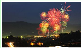
岡山県 金時まつり