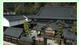
鳥取県 石谷家住宅