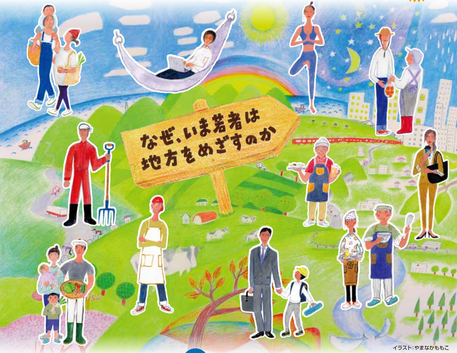
イラスト:やまなかももこ