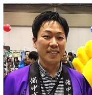
担当 高梁市役所 住もうよ高梁推進課