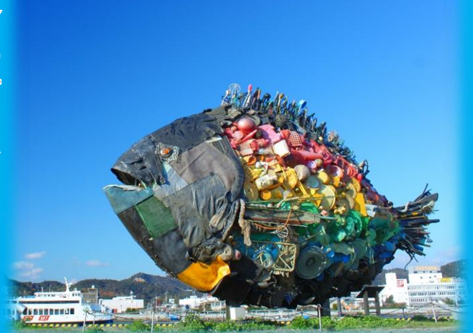
玉野市「宇野のチヌ／淀川テクニック」

岡山県玉野市・美咲町からアート活動に取り組む先輩移住者をお迎えしてトークセッションを開催。地域の魅力や子育てなど、いろいろな移住者目線でのお話も聞けるかも・・・お気軽にご参加ください！！