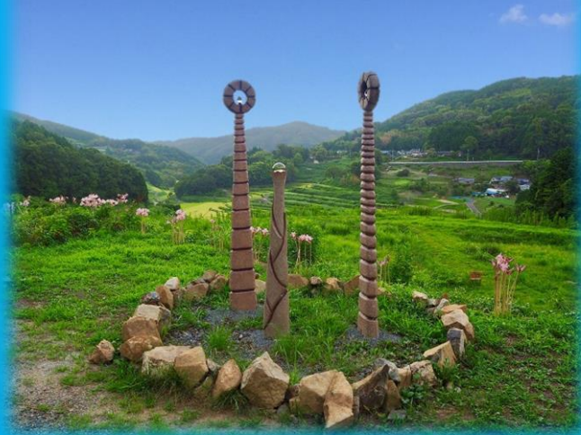
美咲町「創世記の守護者たち」