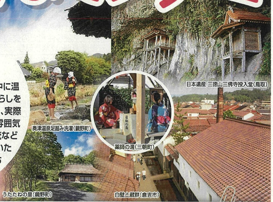
日本遺産 三徳山三佛寺投入堂(鳥取)