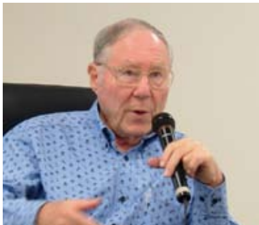
ウィリアム・グラッサー博士

http://www.achievement.co.jp/choicetheory_dvd/