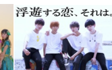
▲浮遊する恋、それは。