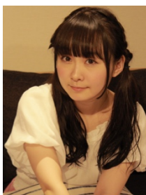
&IDOL デコレーション プロデューサー