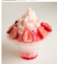
▲&IDOLいちごスペシャルかき氷 ¥800

ビジュアルフードクリエイター協会を発足し会長として活動中。レシピ、メニュー開発はもちろん、簡単キャラ弁やビジュアルフードを考案する他、料理対決や料理クイズに出演。一般向けのレッスンやワークショップを開き講師としても活躍している。