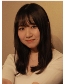
&IDOL フード プロデューサー

今回は皆さんの夏の思い出に残るようなメニューをプロデュース出来たらと思っています！よろしくをお願いします！