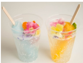
▲アイスキャンディーソーダ (ラムネ/つぶつぶみかん) 各¥700