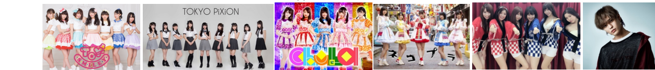
▲TOY SMILEY ▲TOKYO PIXION ▲chuLa ▲ネコブラ ▲発掘！グラドル文化祭 ▲バトシン from XOX