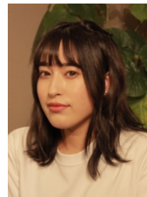
&IDOL インバウンド プロデューサー

みなさんと最高の夏にしていきたいなって思っています！沢山いい思い出作っていきましょう！