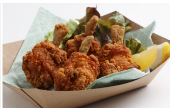
▲チキンロリポップ ¥700