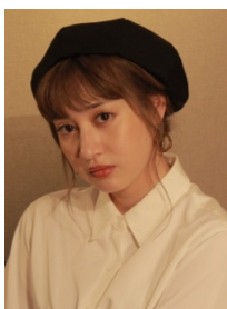
&IDOL フォト プロデューサー

一緒に沢山の思い出を形にできるように、そして&IDOLの魅力伝えつつ、さらに輝かせられるように頑張ります！