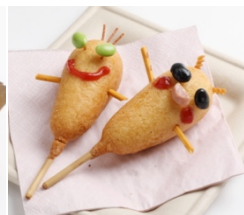
▲ナトリック&ドック ¥600