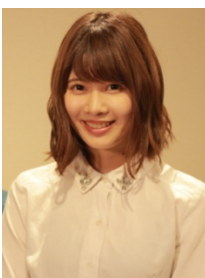
&IDOL 総合プロデューサー

この夏、皆様と一緒に、アイドル業界をより一層盛り上げていけるよう、精一杯頑張ります！！素敵な夏にしましょう♪