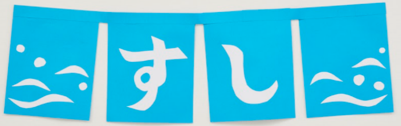
「はずれにくいねじりはちまき」と「画用紙のれん」