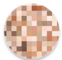
ノーマルモザイクA