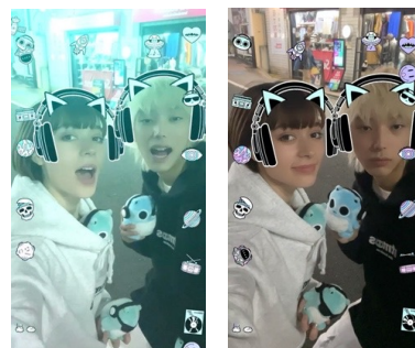
▲ARフィルターイメージ

※スケジュールおよび内容は都合により変更になる場合がございます。予めご了承ください。