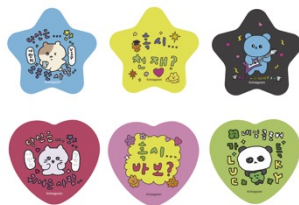
ランダム缶バッジ (全6種) 各550円