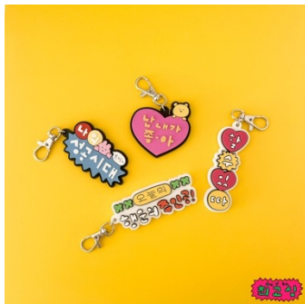
ラバーキーホルダー (全4種) 各990円