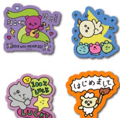
ダイカットステッカー (全4種) 各220円