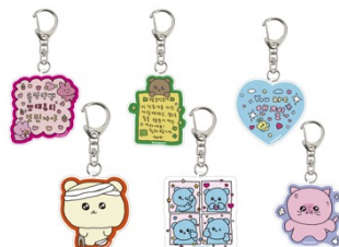
ランダムアクキー (全6種) 770円