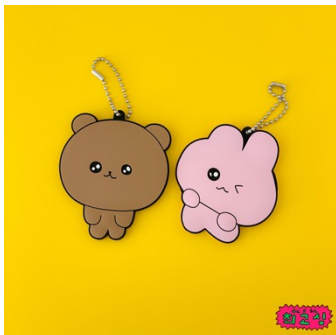
ラバーミラー (全4種) 各1,650円