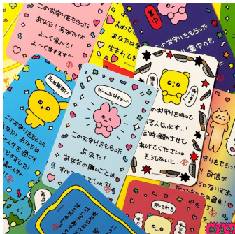
お守りカード[日本語版] (全30種) 各165円