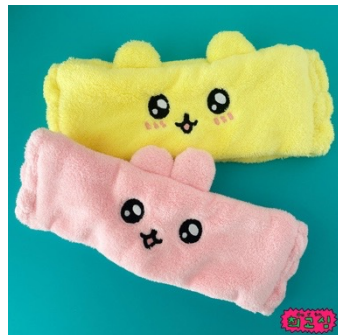
ヘアバンド (全4種) 各1,760円