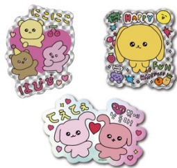
ホログラムステッカー (全3種) 各275円