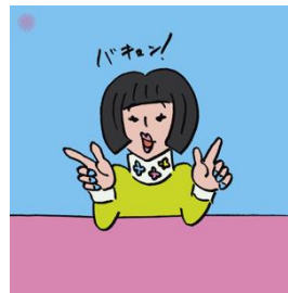
あさぎーによのバキュン