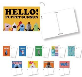
ポストカード (全10種) 各220円～330円