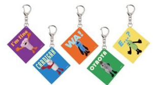
ランダムスクエアアクリルキーホルダー (全5種) 各660円