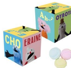
パペットスンスンラムネ 880円