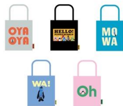
トート (全5種) 各1,980円