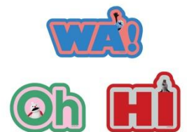
マグネット (全3種) 各1,210円