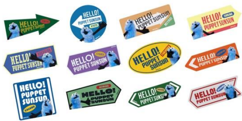
ご当地ステッカー HELLO! PUPPET SUNSUN (全12種) 各330円