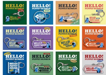
ご当地アクリルキーホルダー HELLO! PUPPET SUNSUN (全12種) 各660円