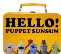
HELLO! PUPPET SUNSUN ビスケット缶 1,650円