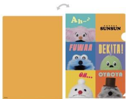
クリアファイル (全6種) 各550円