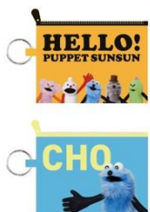
キーリング付きミニポーチ (全2種) 各880円