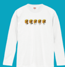
ロングTシャツ 3,800 円 (税込)