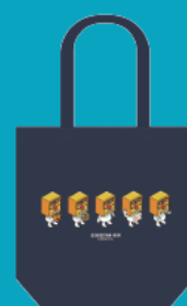
トートバッグ 2,800 円 (税込)