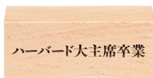
ハーバード大主席卒業