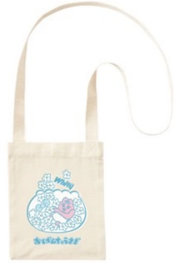
オリジナルコラボアイテム （サコッシュ）