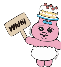
オリジナルコラボ ステッカー