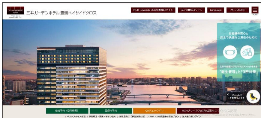
三井ガーデンホテル豊洲バイサイドクロス HP

また、本チャットボットのシステム構築を担当したアイアクトは、ひとつの設問に対し各ホテルに合わせた回答を使い分ける機能を実現しました。全 38 ホテルに共通する問い合わせ内容は一元管理できるようにした一方、ホテル毎に異なる問合せ内容は個別に管理できるように設計し、メンテナンス工数を削減、コストパフォーマンスの高いシステムを実現しました。