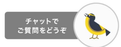
AI チャットボット キャラクター「キビキビ太」