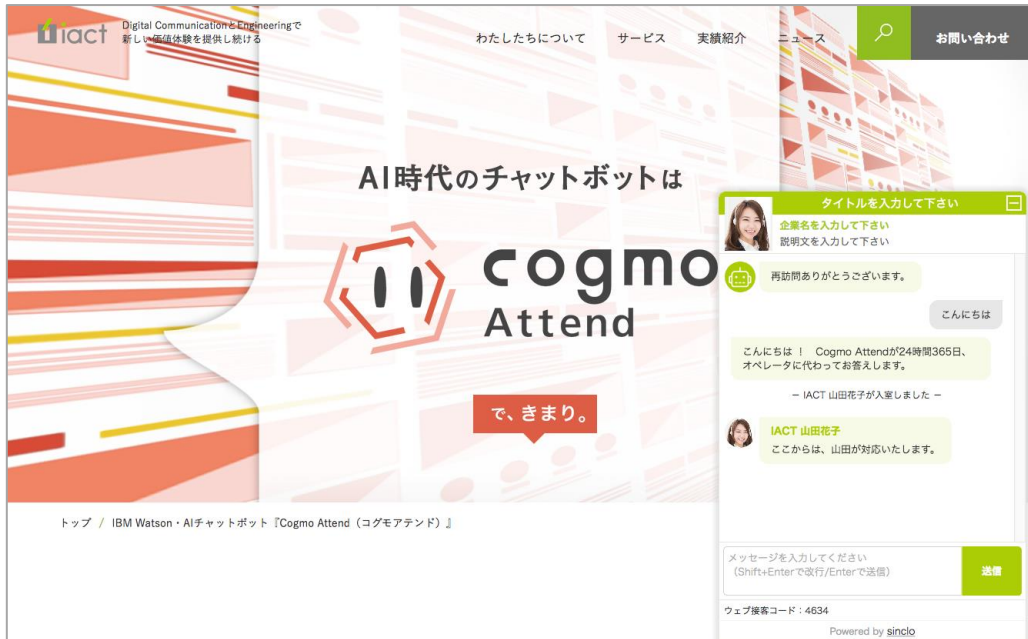
オペレーターインサート時（ユーザ側画面）