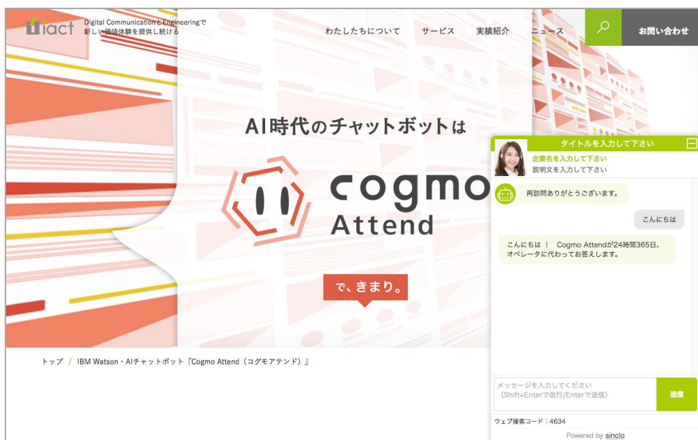
チャット開始のコメント入力時、はじめは Cogmo Attend が自動で応答します。(ユーザ側画面)