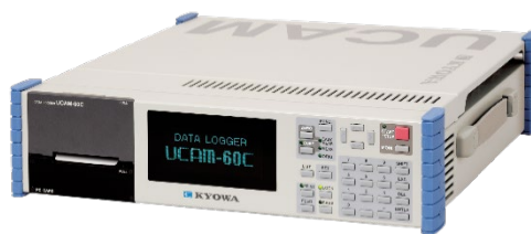
従来機種（UCAM-60 シリーズ）