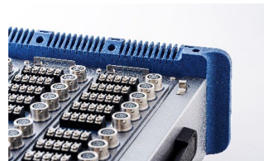
リード線スリット

リード線スリットを採用して、多チャンネル測定時のケーブルマネジメントを改善しました。また、外部メディアは従来の USB メモリに加えて SD カードに対応しました。