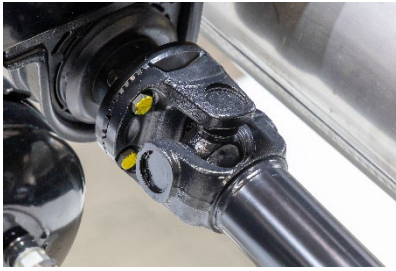
ドライブシャフトトルク計測