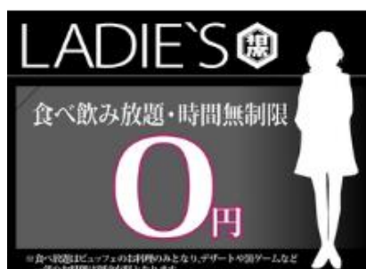
<料金システム(女性)>

「相席屋」Facebook: https://www.facebook.com/aisekiya.2014