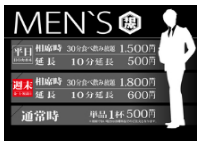
<料金システム(男性)>