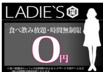
<料金システム(女性)>

「相席屋」Facebook: https://www.facebook.com/aisekiya.2014