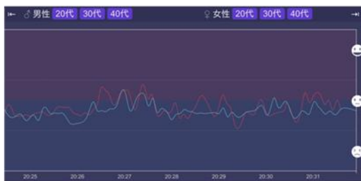
会話が弾んでいない（盛り上がっていない）