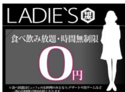
<料金システム(女性)>

「相席屋」Facebook: https://www.facebook.com/aisekiya.2014