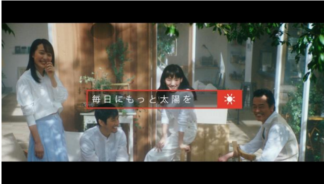
Every Day is a Sunny Day コンセプト篇： https://youtu.be/yQYVH6q_DBE

豪華出演陣の“素の姿”に注目！新キャンペーン「Every Day is a Sunny Day」スタート 綾瀬はるかさん、西島秀俊さん、遠藤憲一さん、駒井蓮さんが勢揃いのスペシャルムービー 「Every Day is a Sunny Day コンセプト篇」が6月15日（木）より公開！ その撮影の裏側ではまさかの綾瀬さんへのドッキリCM撮影も！ スペシャルムービー・ドッキリCMを含めた各コンテンツが本日より特設ページにて先行公開