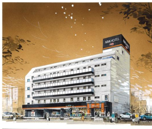
アパホテル〈TKP 東京西葛西〉外観

ホテル名称 アパホテル〈TKP 東京西葛西〉 所在地 東京都江戸川区西葛西 6-15-24 敷地面積 618.86 ㎡ 延床面積 2549.60 ㎡ 構造・規模 鉄骨造 地上 6 階建て 客室数 124 室 開業 2017 年 12 月 1 日 アクセス 東京メトロ東西線「西葛西」駅 徒歩 1 分