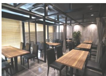
▲ラウンジ 40 席