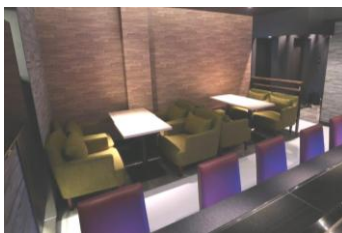
▲カウンターテーブル 8 席