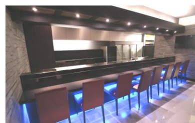
▲カウンター 8 席