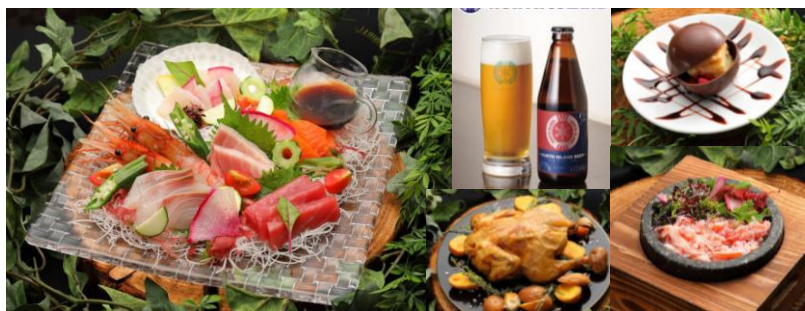
（左）絆の旬鮮盛り合わせ （真中上）北海道地ビール「ノースアイランド」 （真ん中下）丸鶏のハーブロースト （右上）ショコラブラウネット （右下）ズワイ蟹と根菜の釜飯

「Kizuna Susukino S4」自慢の料理をぜひ味覚と視覚でご堪能ください。