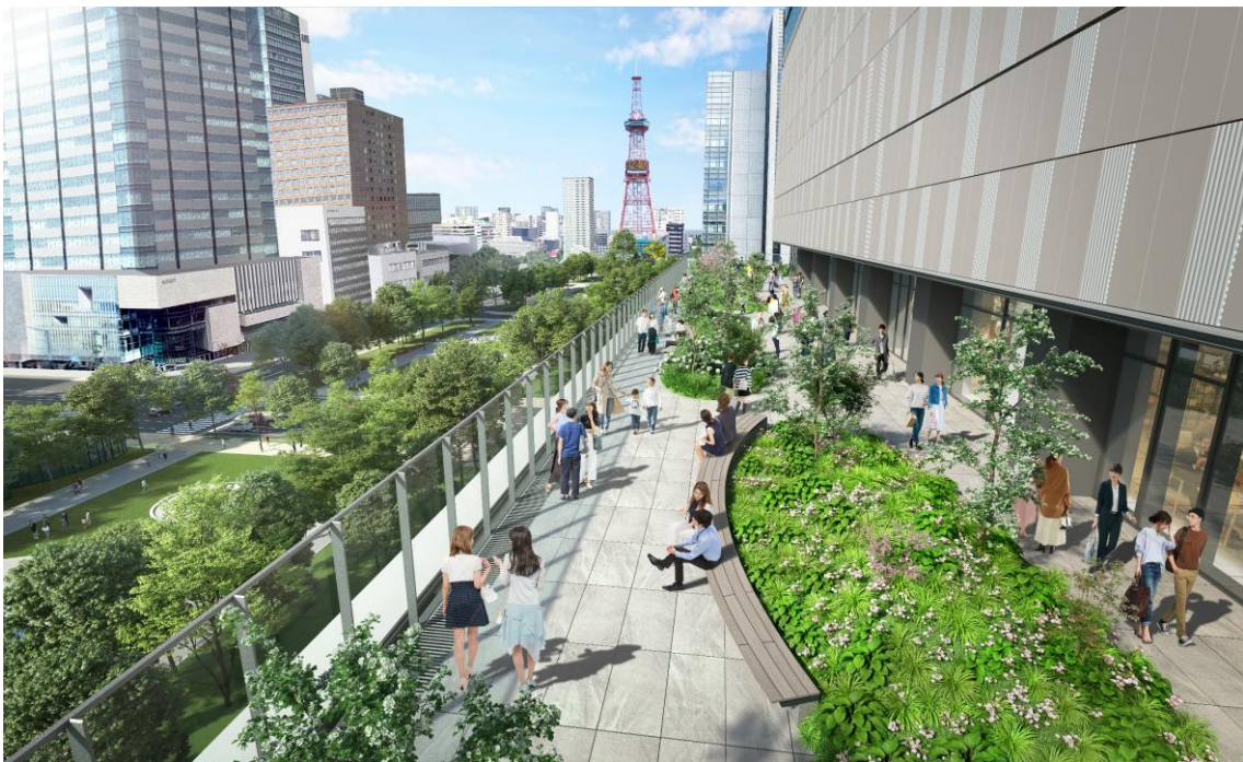
屋外テラスイメージパース