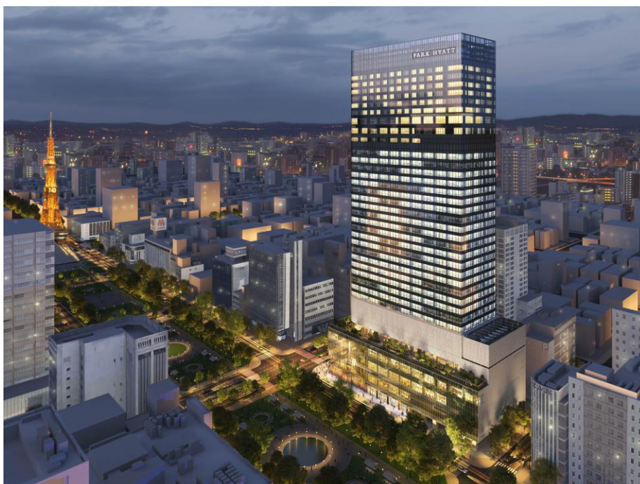
建物外観イメージパース