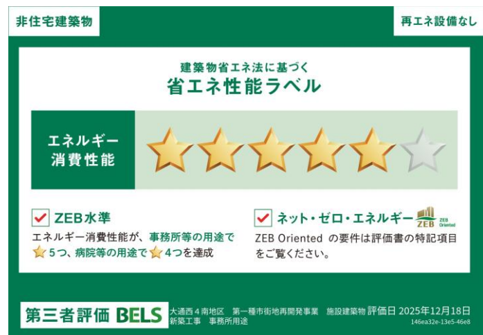
省エネ性能ラベル