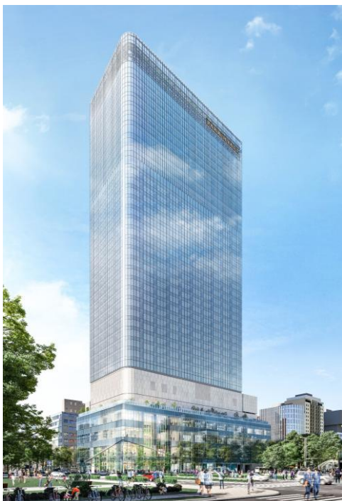
建物外観イメージパース

今後もサステナビリティ経営の実践を充実させることにより、サステナブルな社会の実現に貢献してまいります。