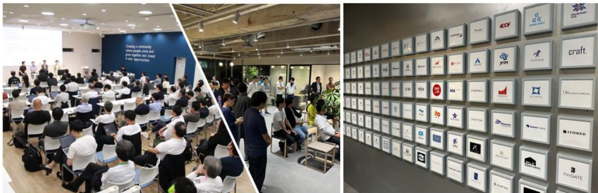
東京日本橋兜町・茅場町「FinGATE」の様子

平和不動産が東京日本橋兜町・茅場町エリアで展開する「FinGATE」は、国内外の独立系資産運用会社やフィンテック等金融系スタートアップの他、VC/PE、金融庁財務局の拠点開設サポートオフィス、国内初の官民連携金融プロモーション組織 FinCity.Tokyo や Fintech 協会等の業界団体など、114社が集積しています。現在、東京では6施設を展開しており、オフィスやイベントスペース等のインフラ整備に加え、情報発信機会の創出、ビジネスマッチング、ミドルバックサービスの導入支援など、入居企業や施設利用者の成長ステージに応じた多面的なサポートを行っています。