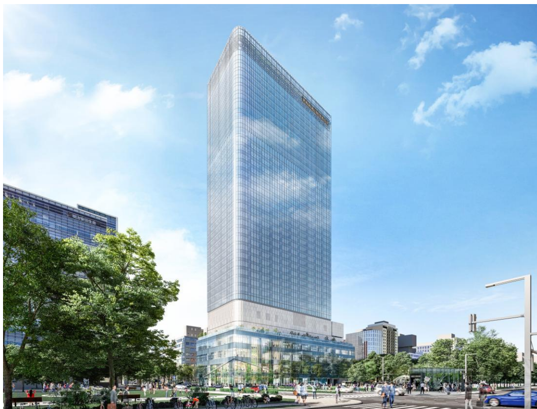
建物外観イメージパース

当社は、今後もサステナビリティ経営の実践を充実させることにより、持続可能な社会の実現に貢献してまいります。