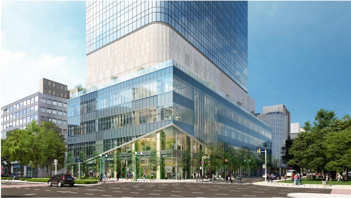
低層外観イメージパース