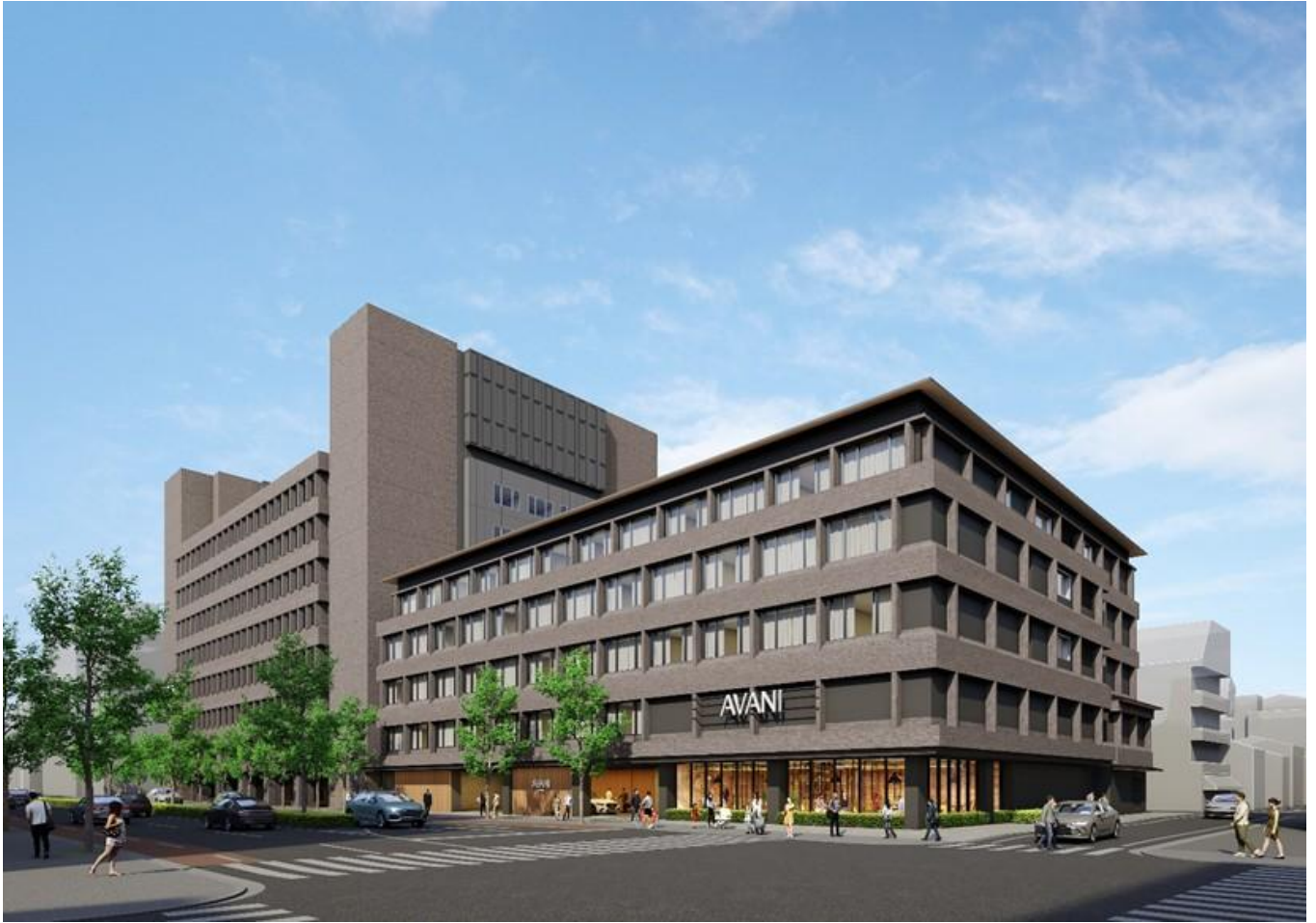
(仮称) Avani Kyoto (アヴァニ京都) の外観

※現時点の外観パースであり、今後の設計ならびに協議等により変更が生じる場合があります。