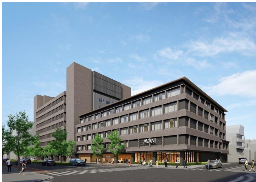
（仮称）Avani Kyoto（アヴァニ京都）の外観

グループ長期ビジョン「WAY 2040」の実現に向けて、本事業の推進により、新規事業分野であるホテル事業を拡大することにより当社の企業価値向上を図ってまいります。