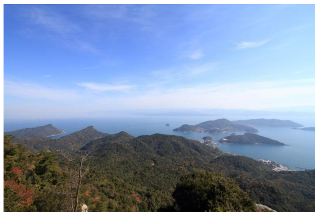
▲高舞登山展望所からの眺め

所在地：上天草市 TEL：0969-56-3133（天草四郎観光協会松島観光案内所） HP： http://www.t-island.jp/p/spot/detail/191