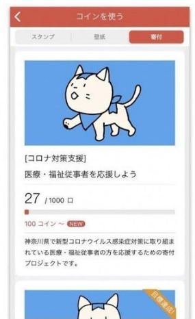
貯めたコインで寄付！

同じ目標を持つ5人1組のチームで励まし合いながら生活習慣の改善を目指す「みんなチャレ」では、アプリで習慣化にチャレンジしたユーザーにはみんなチャレ独自のコインが付与され、そのコインで寄付プロジェクトに参加することができます。今回、医療用マスク1000枚相当分の金額をエーテンラボ株式会社が寄付することを目指します。