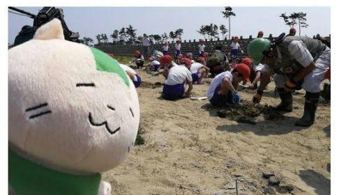
東日本大震災寄付プロジェクト活動