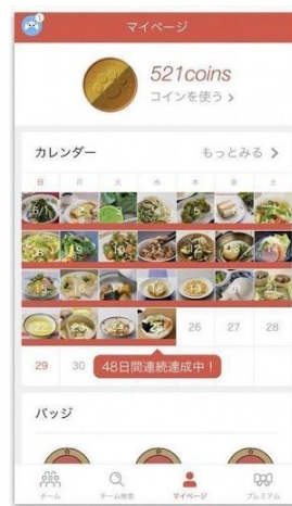
毎日チャレンジを続けて コインを貯めよう