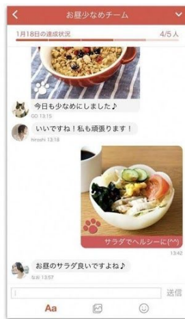
チャットでチャレンジの 証拠写真をチームに共有、 励ましあって習慣化！