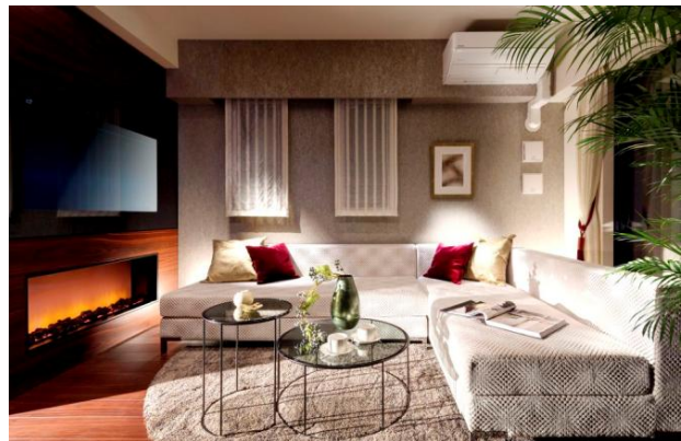
「名古屋総合マンションギャラリー」リビング

「これまでの常識にこだわらず、あるべき姿を形にする」をコンセプトに、都心部を中心に展開する当社のマンションブランド「オープンレジデンシア」シリーズ。2017年9月23日（土）に販売を開始する「オープンレジデンシア葵（名古屋市東区葵）」を第一弾として、今後、名古屋都心部における本格展開を予定しています。