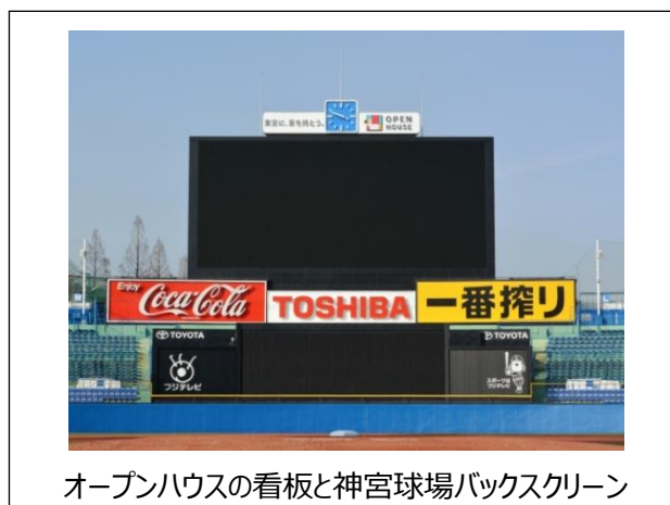
オープンハウスの看板と神宮球場バックスクリーン