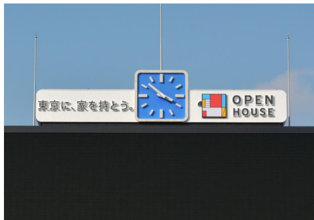
神宮球場バックスクリーン上部のオープンハウスの看板