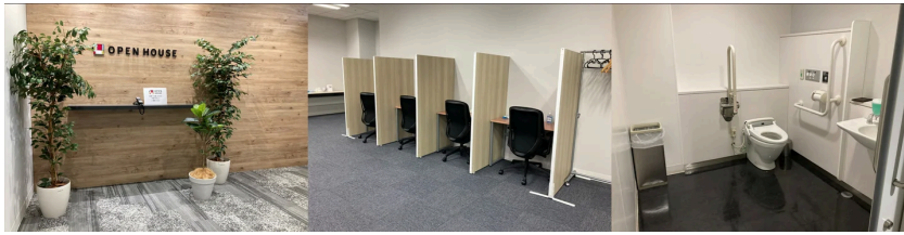
バリアフリー等の工夫が施された、オフィスの様子

当社は、「障害者の雇用に関する状況報告（障害者雇用状況報告）」に関して、2025年6月1日時点の障がい者雇用人数が140名を超え、現在の法定雇用率2.5%及び2026年7月から適用される法定雇用率2.7%をも上回る、雇用率3.06%を達成いたしました。