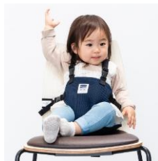
キャリフリー チェアベルト ショルダー&メッシュ 日本エイテックス株式会社