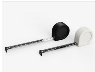
ミドリ スローコンベックスメジャー 株式会社デザインフィル