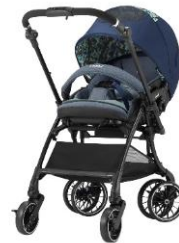
スゴカルSwitch コンビ株式会社