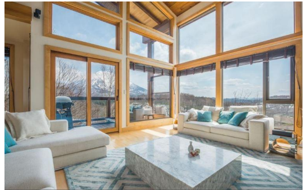
④北海道・ニセコ 緑に囲まれた別荘