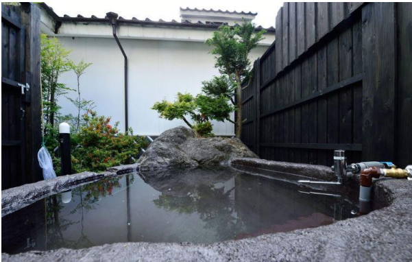
③九州・湯布院 露天風呂付き一軒家