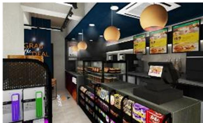
<レジカウンター デザインイメージ>