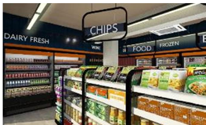
<店舗内観 デザインイメージ>