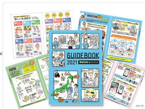
*ガイドブックの配布は契約内容によって異なります

出産、入学、結婚、住宅購入など人生の大切なライフイベントに、従業員とご家族の「健康で豊かな暮らしをサポートする”お祝い&応援制度”や”介護支援制度”は、制度の種類や詳細が記載されており、人生の節目に受けられる制度を見つけやすいです。