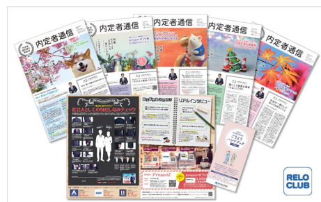
▲ご利用ハンドブック(8月)と内定者通信(11月～3月まで5回発行)

これらの福利厚生サービスを通じて、学生は内定企業への帰属意識を高めやすくなり、人事担当者とのコミュニケーションを活性化するツールとしても最適です。