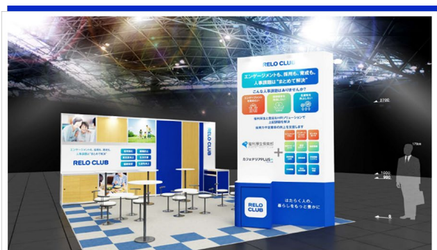
▲HR EXPO E10-30

近年、企業を取り巻く環境は大きく変化しており、物価上昇への対応、人材採用競争の激化、従業員エンゲージメントの向上、多様化する働き方への対応など、総務・人事部門に求められる役割はますます重要になっています。一方で、賃上げや各種制度の拡充にはコスト面での課題もあり、限られた予算の中で従業員満足度を高める施策が求められています。