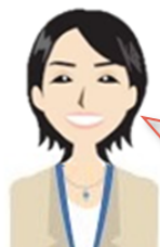
ふくりのふるさと納税担当 Y 女史

私のおすすめ返礼品をご紹介します！ 今まで気づかなかった、あなたにピッタリの逸品が見つかるかもです。 参考にしてみてくださいね♪