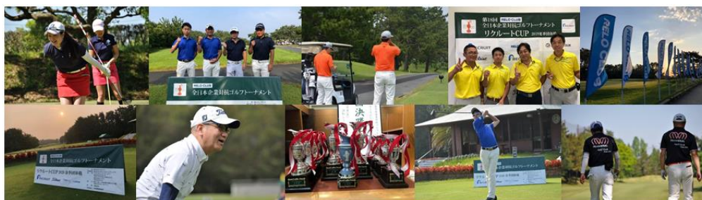
▲RELO CLUB全日本企業対抗ゴルフトーナメント 過去大会の様子

また、本大会の上位になると、年1回開催される個人戦全国大会に出場することも可能で、さらに楽しみが増します。