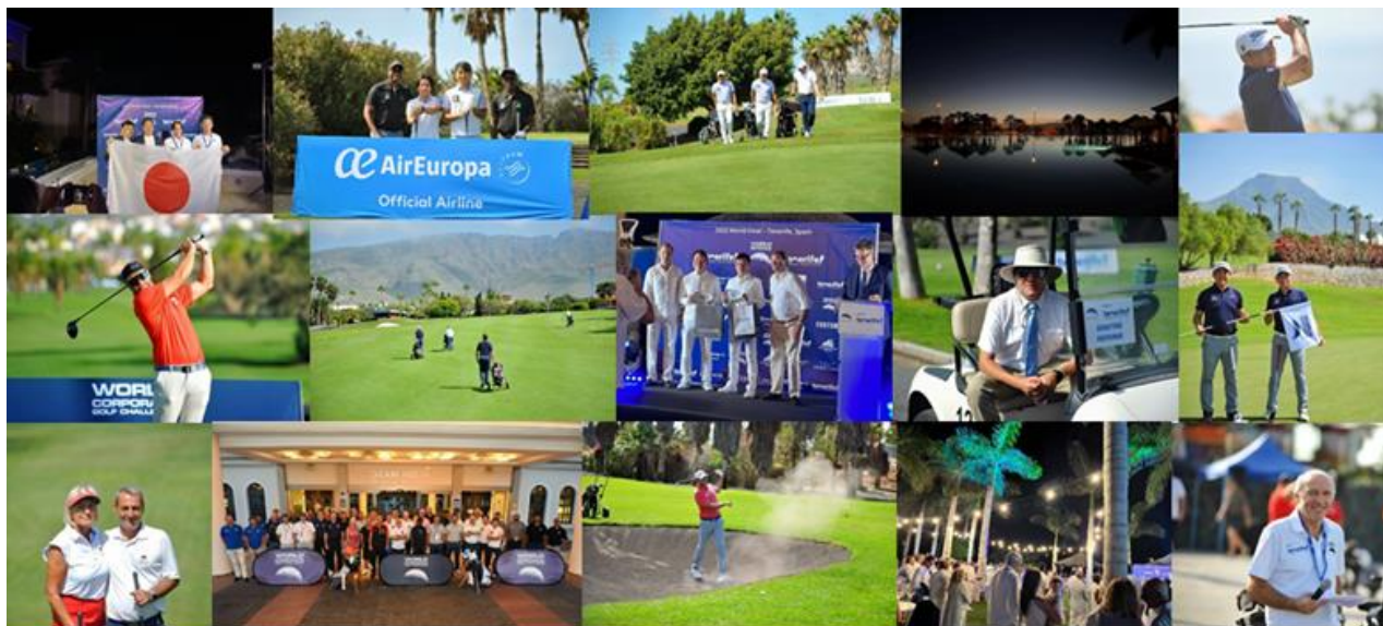
▲ワールドコーポレートチャレンジ(WCGC)2022 World Final (スペイン領 テネリフェ島)

来年度のWorld Finalに出場するのは、現在募集中のダブルススクランブル『EAGLE VISION CUP 2022』【大会 HP: https://www.kigyo-golf.com/?page_id=34019 】の優勝チームとなります。