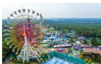
▲那須ハイランドパーク【栃木】 一般価格 1,600円 → 応援キャンペーン価格 500円 + ギフトポイント