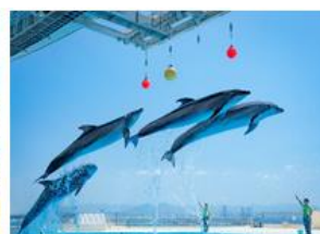
▲マリンワールド海の中道【福岡】 一般価格 2,350円 → 応援キャンペーン価格 1,170円 + ギフトポイント

※優待価格の上、さらに福利厚生倶楽部ポイントプログラムのClubGiftのポイントが最大500ギフト付与されます