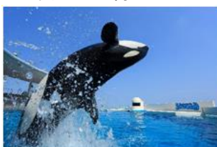
▲鴨川シーワールド【千葉】 一般価格 3,000円 → 応援キャンペーン価格 1,400円 + ギフトポイント