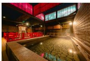
▲太閤の湯【兵庫】 一般価格 2,970円 → 応援キャンペーン価格 1,500円 + ギフトポイント