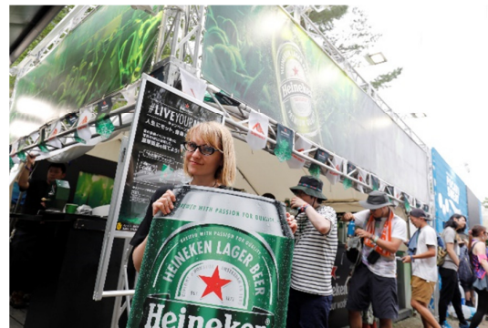
画像：これまでのフジロック協賛の様子

協賛20年目となる今年、当社ではハイネケン・ブランドの思いを「#オンガクと生きる」というメッセージに込め、フジロックフェスティバルを通じて皆様の新しい世界を開くきっかけづくりを応援する本キャンペーンの実施に至りました。