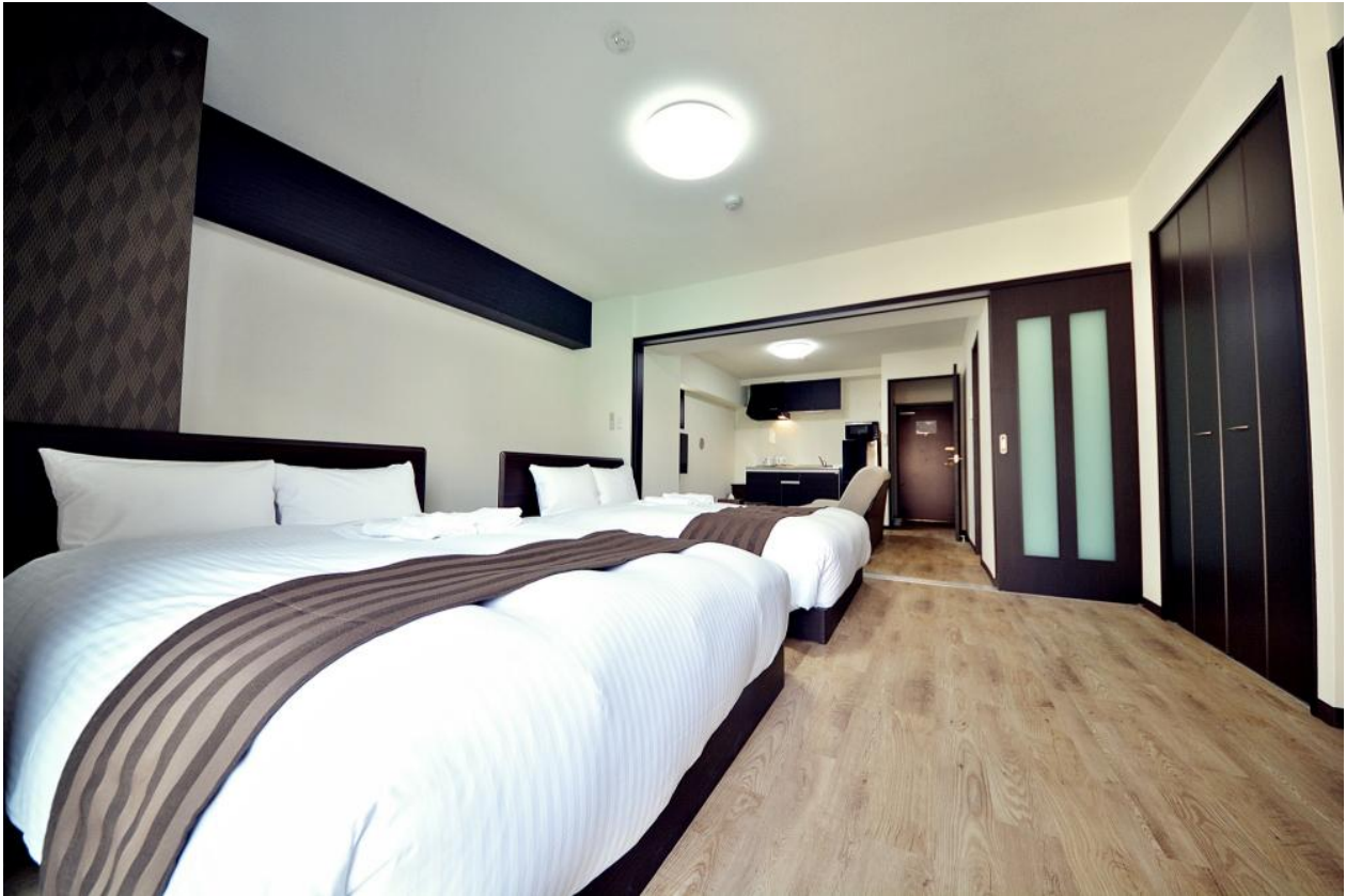
▲客室例（ダブルベッド×2の客室）