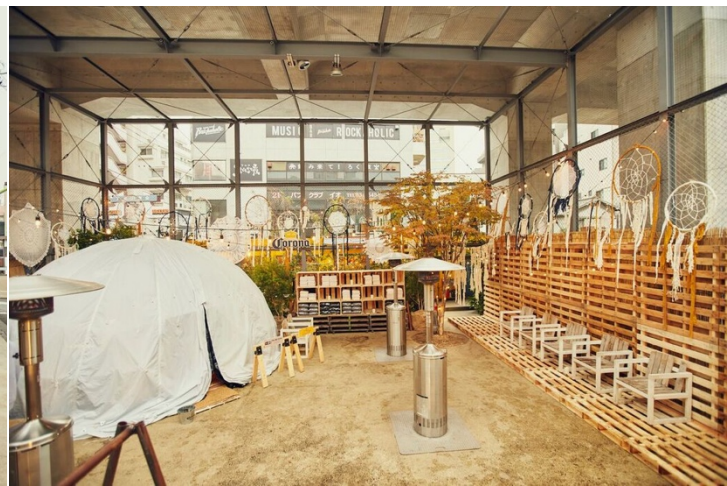
▲下北沢のど真ん中に位置するイベント会場はコロナの世界観に！！