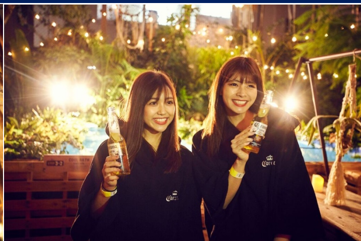
▲会場内の様子。サウナが終わった後はコロナビールで乾杯！