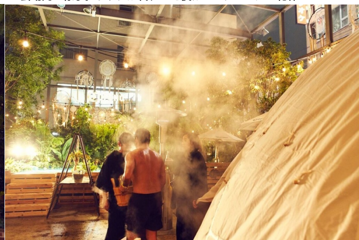
▲会場内の様子。サウナから出て来た直後は体から湯気が！