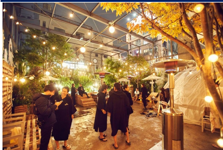
▲会場内の様子。外気浴を楽しみながらチルアウト