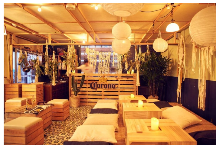
▲会場内の様子。サウナ⇄水風呂を3セット繰り返した後は室内スペースで心地よい音楽を聞きながらフードとコロナビールで乾杯！！