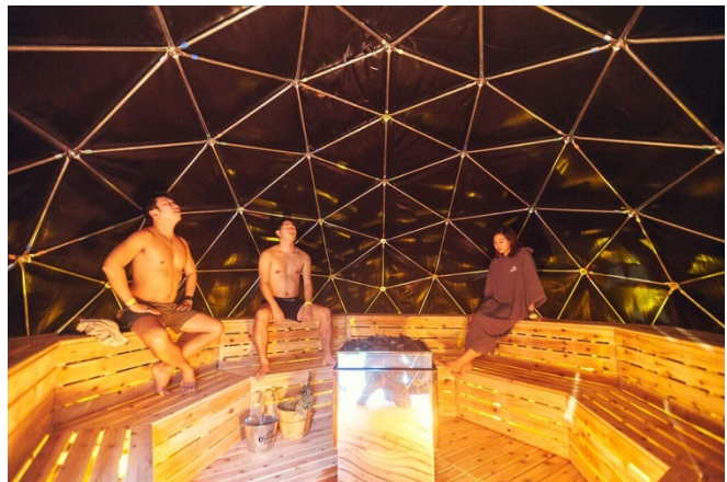
▲ドーム型のサウナテントの中。「ロウリュ」は高温に熱したサウナストーンに水をかけ、水蒸気を発生させることにより体感温度を高めて発汗を促します。

ここ数年幅広い層から「サウナ」が注目されブームとなっており、中でもサウナ発祥の地・フィンランドで生まれた「ロウリュ」がサウナ愛好家（通称：サウナー）からも注目を浴び話題となっています。先日開催された「CORONA WINTER SAUNA」は屋外に特別設置されたテントで「ロウリュ」を体験できるというアウトドアサウナイベント。水着でたっぷり汗をかいた後、併設された水風呂、そして外気浴を、スペシャルな空間で楽しんで頂きました。2日間の開催で総勢63組195名の方々にご参加頂きました。